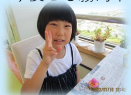
かわいいどんぐりアートが出来たね(▽)/

2023年7月16日に、開館2周年を迎えました！ これまでご来館された方々に感謝申し上げます。 これからも、皆様が楽しく安心してご利用いただけるよう、 「安心の子育てパーク」を目指していきます。 今後とも霧島市こども館すかいぴあを宜しくお願い致します！