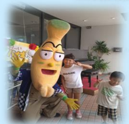
バナオくんもきたよ！ありがとう☆