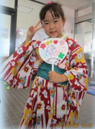
うちわ作り 楽しそう♡