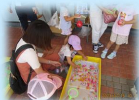
お菓子釣り、上手に釣れたね(*▽*)